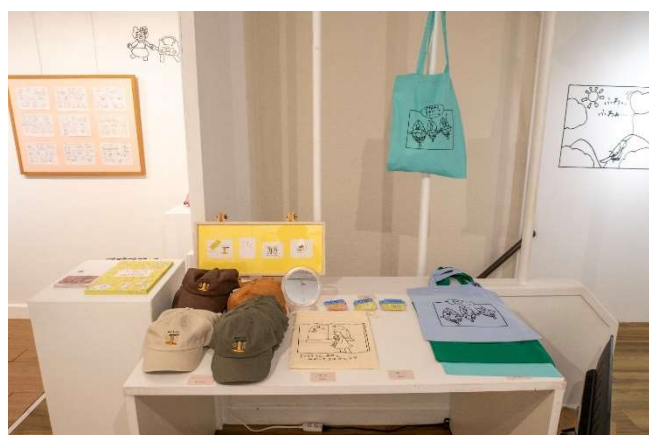
グッズ販売の様子