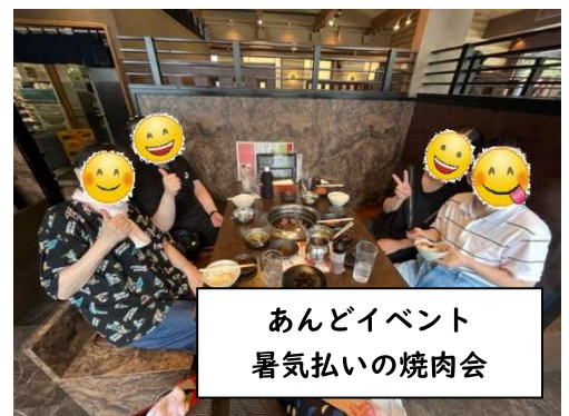
あんどイベント 暑気払いの焼肉会

これからも利用者さんたちが充実した時間を共に過ごせるよう、より一層努力していこう、と思う次第です。