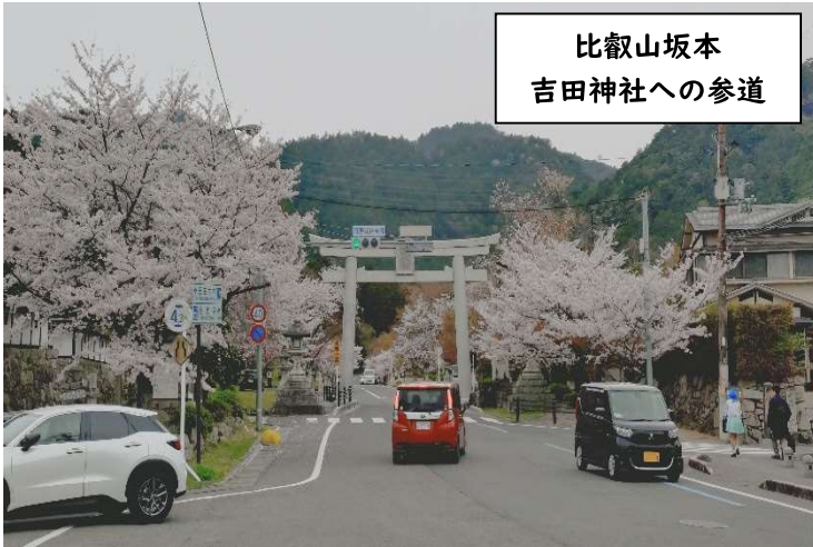
比叡山坂本 吉田神社への参道

生活サポートセンター『ほっと』（以下『ほっと』）は居宅での介護や、外出の支援を行っています。外出については季節のお出かけをご希望される方も多く、春先では「花見に行きたい」とのご希望で、山科を少し離れて桜を見に行くこともあります。