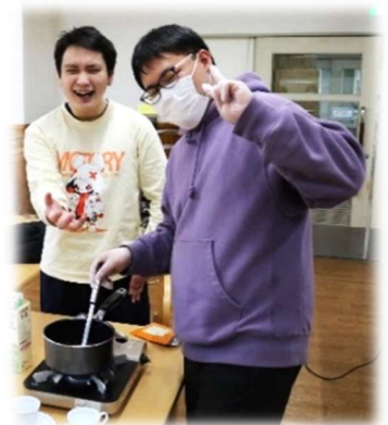
ミルクティ煮込み中！

その中で2025年度の活動を振り返るスライドを大画面で見ながら思い出話に花を咲かせておられました。