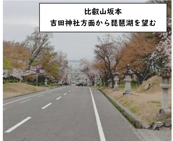
比叡山坂本 吉田神社方面から琵琶湖を望む

利用者の皆さんは、ヘルパーが来るのを楽しみにして待っておられるので、少しでも目新しいものを感じていただこうと、一つの例として、太秦の映画村を訪ねる等、普段の生活ではなかなか感じることでできない、外出の特別感・非日常感、「ちょっとしたいつもとは違う楽しみ」を感じていただけるよう心掛けています。