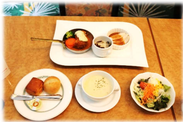
ホテルランチのお食事