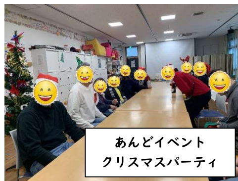
あんどイベント クリスマスパーティ

共同ホームあんども、回数は多く開催できませんが、普段とは違う日常が感じられるようイベントを企画・実行しております。