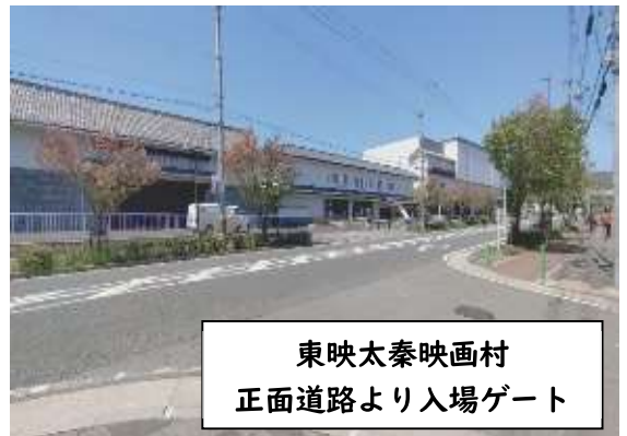
東映太秦映画村 正面道路より入場ゲート

利用者の皆さんは、ヘルパーが来るのを楽しみにして待っておられるので、少しでも目新しいものを感じていただこうと、一つの例として、太秦の映画村を訪ねる等、普段の生活ではなかなか感じることでできない、外出の特別感・非日常感、「ちょっとしたいつもとは違う楽しみ」を感じていただけるよう心掛けています。